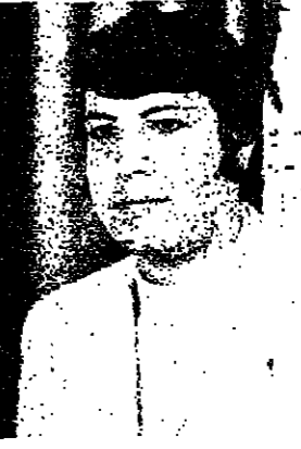
همي خروب نصو ادارة